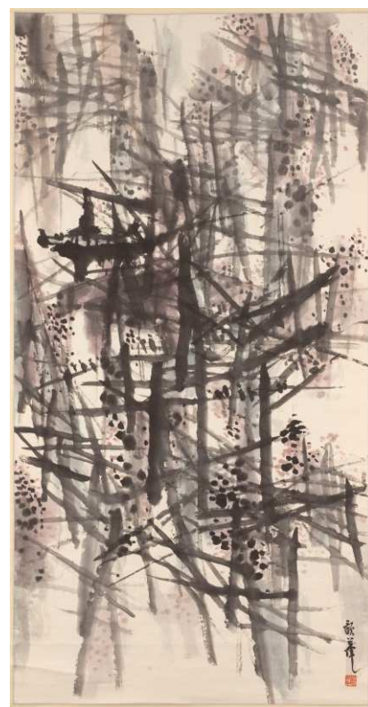
Ungno Lee (1904-1989). "Foule". Encre sur papier, 1987. Paris, musée Cernuschi

Le musée Cernuschi possède dans ses collections plus d'une centaine d'œuvres réalisées entre 1954 et 1989, et dont une sélection présentée dans l'exposition invite le visiteur à découvrir un œuvre foisonnante et à l'énergie communicative. Présentation d'une donation de l'artiste Lee Ungno au Centre Georges Pompidou du 13 septembre au 27 novembre 2017.